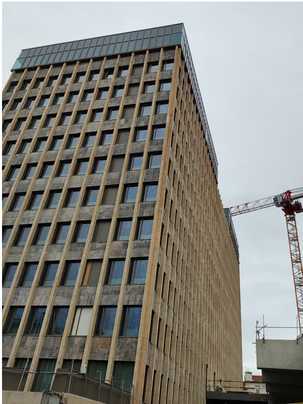
Travaux de la Tour Loubet en cours (février 2025).