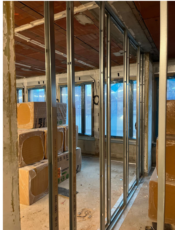
Montants ID 4 prescrits pour la restructuration des 3 étages destinés aux logements.

Située dans le quartier Tarentaize-Beaubrun, la Tour Loubet, ancien siège de la CAF, de l'Urssaf et de la CPAM, fait l'objet d'une transformation profonde. Inscrit au cœur d'un ambitieux projet de requalification urbaine, cet immeuble de 14 étages, culminant à 45 mètres de hauteur, est en pleine réhabilitation lourde depuis juin 2020. Ce projet multi-usage, mêlant bureaux, services municipaux et logements, redonnera vie à un site emblématique de Saint-Étienne.