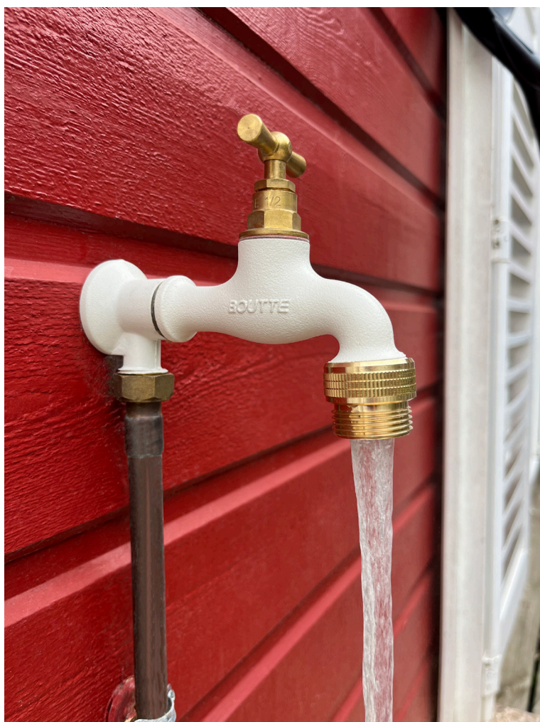
Débit avec le nez mousseur.

fixant sur les robinets de puisage pour assurer l'arrosage du jardin. Cet accessoire autorise l'insertion d'un mousseur pour permettre à chaque jardinier de réaliser des économies d'eau en ajustant le débit selon son besoin. De plus, il réduit les éclaboussures en éliminant le jet en parapluie.