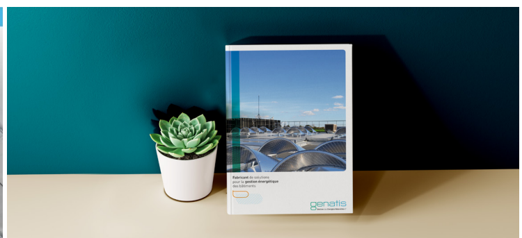
Nouveau site internet et nouveau catalogue pour GENATIS.